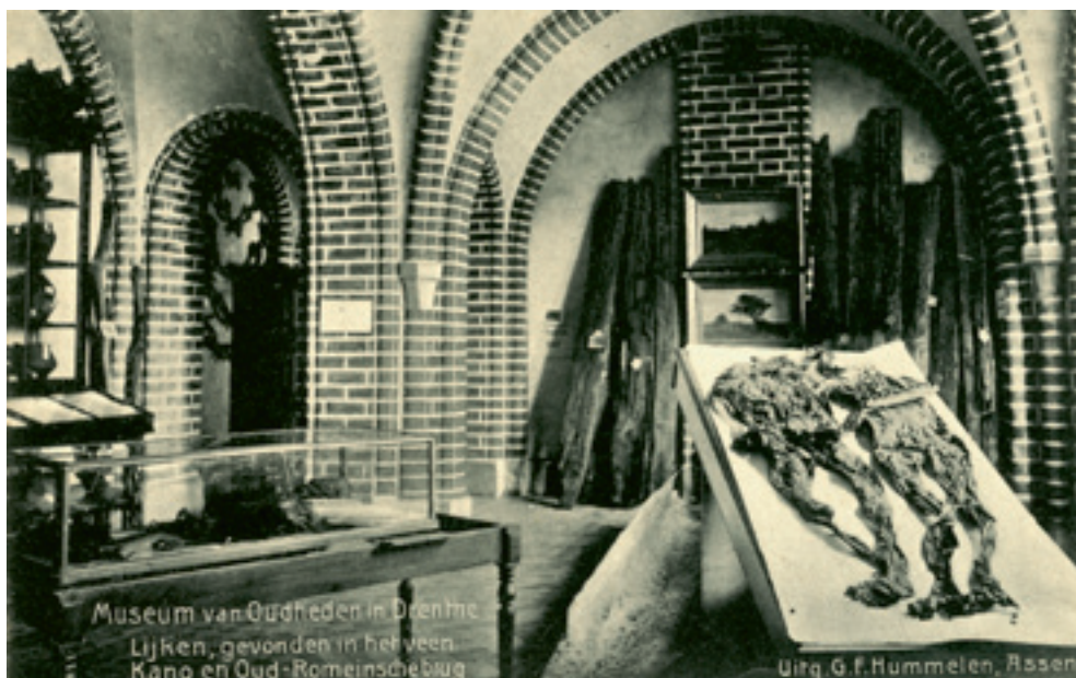
Fig. 6. Archeologische vondsten (ca. 1915?) in het toenmalige Provinciaal Museum van Oudheden in Drenthe. Op de achtergrond de originele planken van de Valtherbrug (Drents Museum).

Het grote aantal in korte tijd ontdekte veenbruggen bewijst dat deze in de oertijd helemaal niet zeldzaam waren en dat het gebruik bij de Germanen algemeen verbreid was, want Zwitserland is ver van de Noordzee verwijderd. Ik vind hierin een bevestiging van mijn hypothese dat moerasen oorspronkelijk met bomen begroeid waren, want alleen hierdoor konden ze in de winter en in vochtige zomers ontoegankelijk worden. Niet door de lage ligging. Zelfs afgegraven venen, ook al zijn ze 4, 6 of 8 voet lager dan het hoogveen, laten zich in elk jaargetijde zonder moeite betreden wanneer ze met gras begroeid en van een waterafvoer voorzien zijn. Dit laatste is zelfs niet nodig wanneer de veengrond enige voeten diep is. Sinds de aanleg van de bruggen zal er geen water op het veen gestaan hebben, zoals de bouw en de ingeslagen stokken bewijzen. Het moet een modderige grond geweest zijn waarop men hem gelegd heeft. Een bodem die van de invloed van zon en licht afgesloten was en daardoor nooit geheel droog werd. Hij was ook niet met een vaste graslaag, zoals die over het veen kan groeien, bedekt. De grond was los genoeg om het water, dat niet afvloeien kon, in zich op te nemen. Alleen onder dergelijke omstandigheden kon de aanleg van veenbruggen of houten wegen noodzakelijk en nuttig zijn. Zonder bomen kan men zich een dergelijke veenbodem niet voorstellen, want poelen waren het niet.