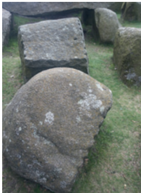
Fig. 3. Hunebed D14 bij Eext. Op de stenen zijn de putjes zichtbaar die, zoals Arends' gids verzekerde op de afdrukken van reuzenvingers lijken.

Waarschijnlijk is dit het grootste van alle hunebedden die er in Duitsland en het noorden zijn. Het herinnert aan het beroemde Stonehenge in Engeland. Het is in de hoogte weliswaar maar half zo groot, de omvang is echter slechts een beetje kleiner, en wat betreft de grootte der dekstenen overtreft het dit sterk. 34