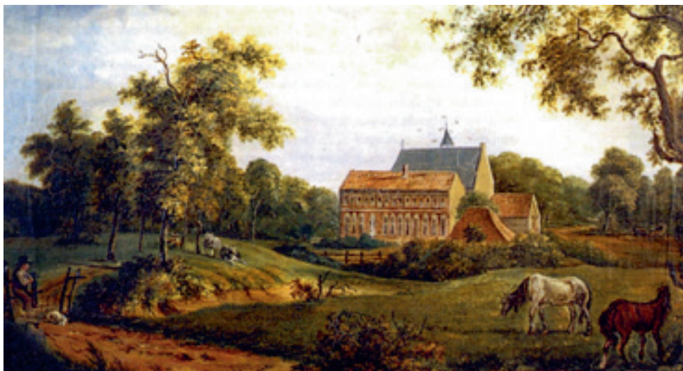
Fig. 7. Schilderij van Arnold Hendrik Koning, Klooster Ter Apel, 1834 ( www.geschiedenisbeleven.nl ).

goed geluk liepen we verder, het nauwelijks zichtbare voetpad volgend. Onze hoop was niet voor niets. Er lag een boom over het water, blij klauterden we daar overheen, dwaalden nog enige tijd over de heide, en kwamen eindelijk bij het kleine dorpje Ter Haar waar een behulpzame boer ons zijn knecht meegaf naar het een half uur verderop gelegen Ter Apel, dat we om 22.00 uur moe en hongerig bereikten.