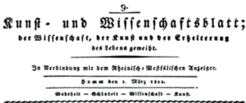
Fig. 1. Kop van het Kunst- und Wissenschaftsblatt waar F. Arends in publiceerde, 1 maart 1822.

Ten gevolge van het vele schrijven bij kaarslicht raakte Arends, naar eigen zeggen, min of meer blind, zodat hij zijn functie bij de Landdrost moest opgeven. 1 Op zoek naar een nieuwe toekomst emigreerde hij in 1833, net als vele van zijn landgenoten in deze periode, naar Amerika. Ook hier schijnt hij uiteindelijk geen geluk gehad te hebben. In 1861 stierf hij, na een leven met veel tegenslagen, in Polk County in de staat Missouri. 2